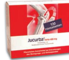
Jucurba® forte 480 mg Nur 2 x tägl. 1 Filmtablette