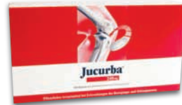
Jucurba® 240 mg 2 x tägl. 2 Hartkapseln