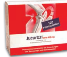
Jucurba® forte 480 mg Nur 2 x tägl. 1 Filmtablette